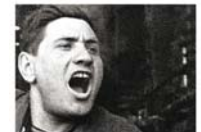
Vasili Grossman Por una causa justa